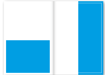
1/2 Seite 1.400 Euro Quer: 190 x 135 mm (S) Hoch: 91 x 277 mm (S) 101 x 297 mm (A)